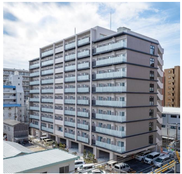
エルプレイス江坂Ⅱ 外観

WELL 認証は、ウェルビーイング（身体的・精神的・社会的な幸福度）の観点から建物を評価する国際的な認証システムで、米国の国際 WELL ビルディング協会 (IWBI) が運営しています。その住宅版として 2023 年 5 月にリリースされた WELL for residential 認証は、建物のハード面からソフト面まで、入居者の健康やウェルビーイングに影響を与える 10 のコンセプト（空気、水、光、栄養、運動、温熱快適性、材料、音、こころ、コミュニティ）およびイノベーション項目で評価します。