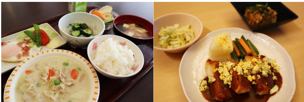
エルプレイスシリーズで提供する食事の例