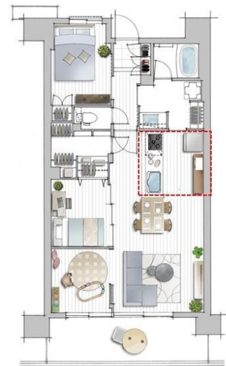
(左) 廊下付けキッチンイメージ図 / (右) 廊下付けキッチンタイプ