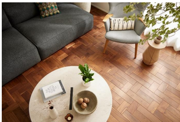
『イニシアフォーラム三鷹』2階リビング

2階リビングの床には、木のぬくもりや上質感、経年変化による味わいも感じられる挽板フローリングを採用。デザイン性のあるパーケット貼とし、日々の暮らしに小さなきめきを綴る空間に。