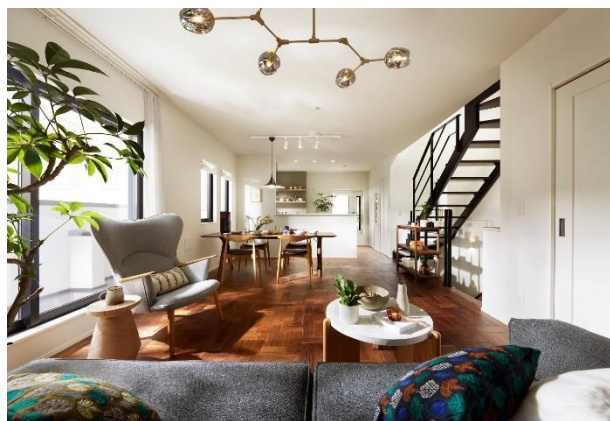
『イニシアフォーラム三鷹』2階リビング