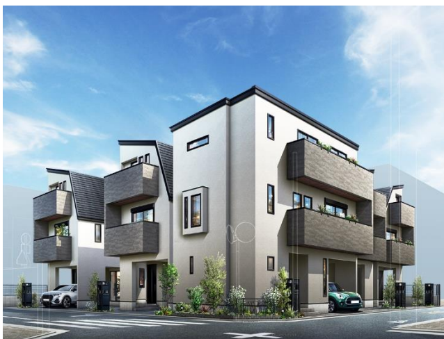
『イニシアフォーラム三鷹』完成予想図