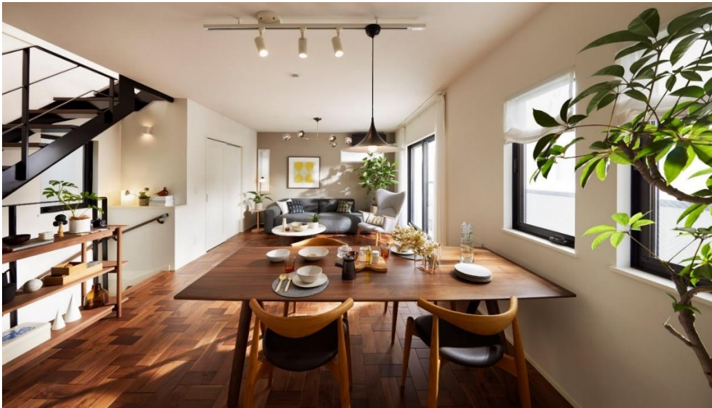
『イニシアフォーラム三鷹』リビング・ダイニング

大和ハウスグループの株式会社コスモイニシアは、プラスαの自由な空間を備えた3建の新築分譲一戸建『イニシアフォーラム三鷹』（東京都武蔵野市、総区画数7区画）を販売開始いたしましたのでお知らせします。