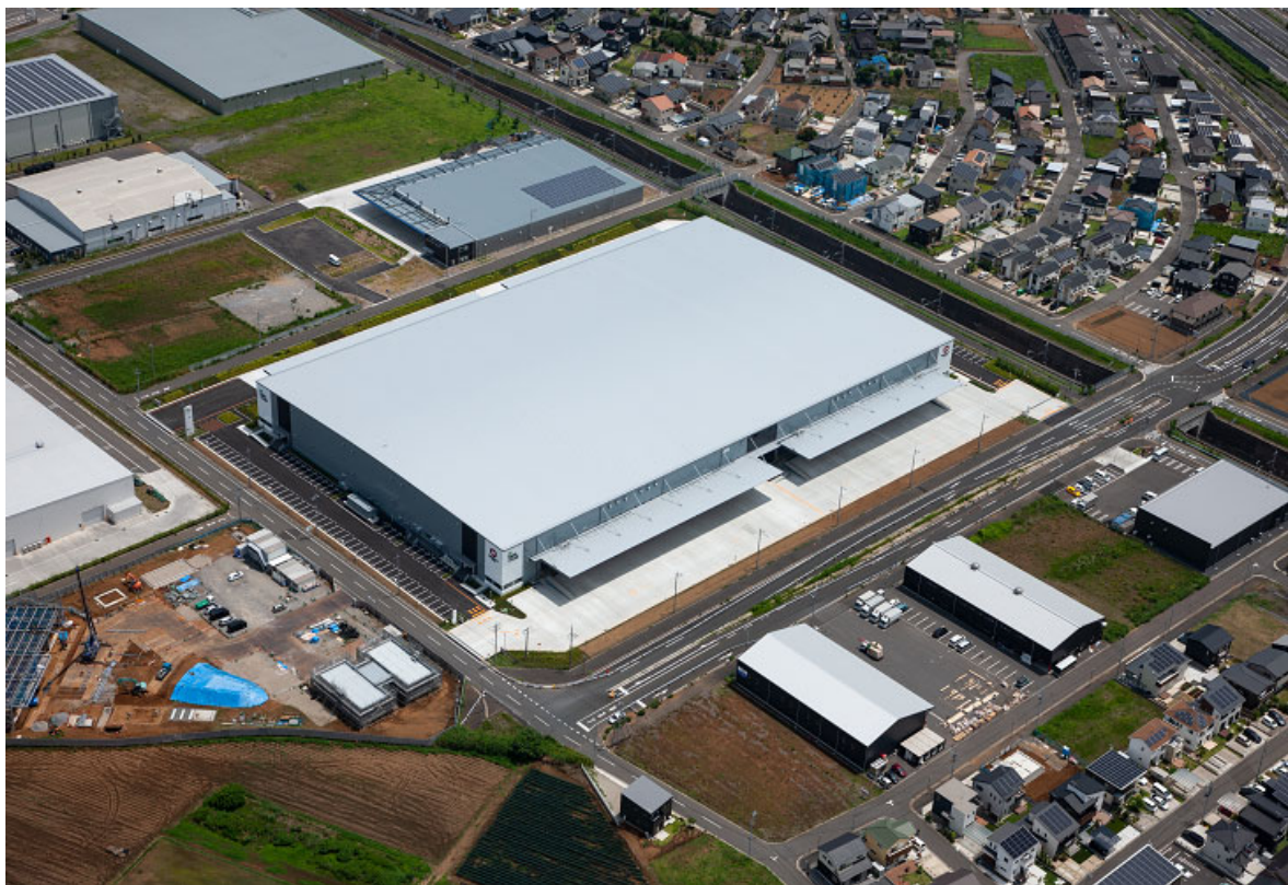
【倉庫外観（空撮写真）】