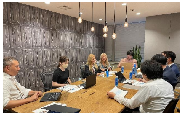
制作についての打ち合わせ