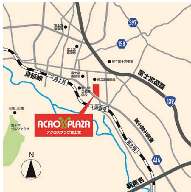
「アクロスプラザ富士宮」地図