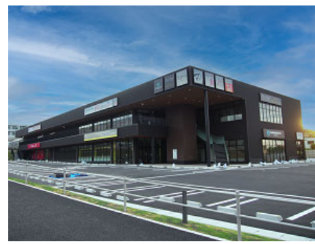
【「アクロスプラザ富士宮」】

当社では、ロードサイドを中心としたアウトモール型の複合商業施設「アクロスプラザ」を全国で約120カ所展開しています。