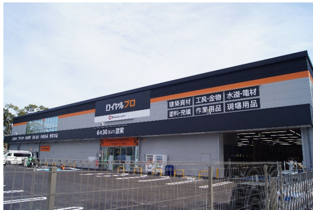
【 ロイヤルプロ住之江公園 】

なお、当店のオープンにより、当社が運営するホームセンターは全国で60店舗目、大阪府では7店舗目、「ロイヤルプロ」としては大阪府初出店となります。