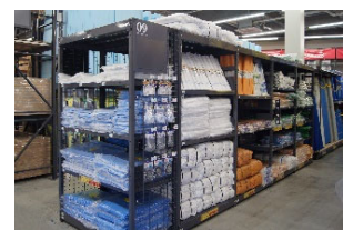
「便利なまとめ買い売り場」

当店は、大阪府道 29 号線沿いに位置し、住之江公園に隣接しています。Osaka Metro「住之江公園駅」から徒歩 3 分、2km 圏内には阪神高速道路の「玉出インターチェンジ」や「住之江インターチェンジ」などのインターチェンジが複数存在するなど、交通利便性の高い立地です。また、早朝営業（6 時 30 分～）や大型商品購入後の車への積み込みサポートの実施、建築材料の充填剤や土木工事で用いる土のうなどのまとめ買い需要に対応した売り場など、朝早い建築現場での作業開始前に、より便利にご利用いただけます。