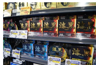
オリジナルブランド「漆黒」