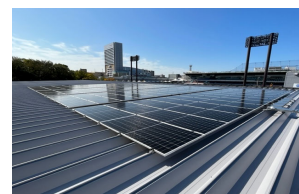
「太陽光発電システム」

また、商用電源には、大和ハウスグループが建設・運営・管理する再生可能エネルギー発電施設の再生可能エネルギー価値（トラッキング付非化石証書 ※2 ）を付加した電力を採用し、施設運営に要する電力を 100%再生可能エネルギーで賄う計画です。