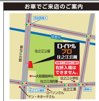
「ロイヤルプロ住之江公園」(案内図)